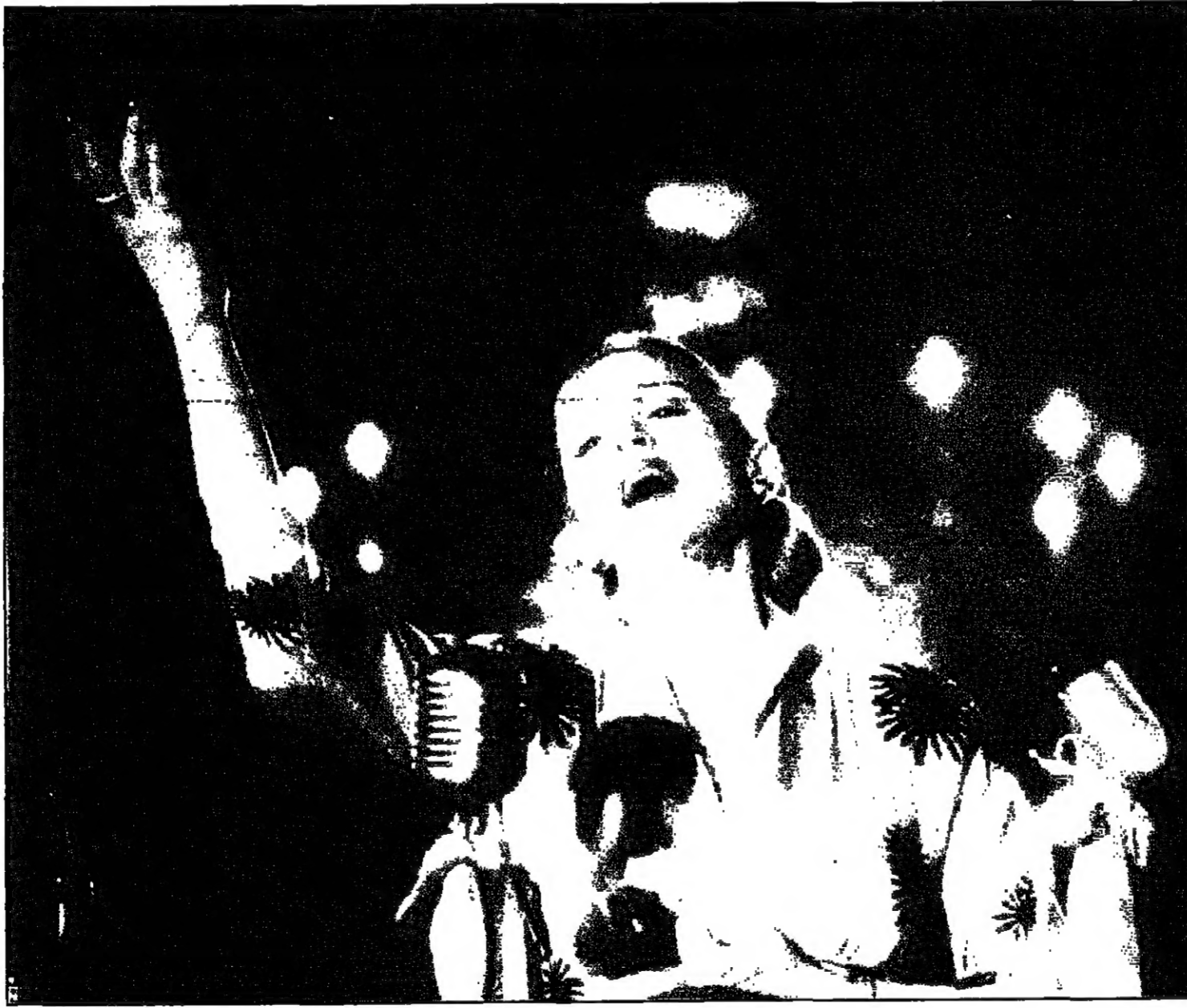
مادونا في دور «دايفينا»

نوع نادر من الغناء ابدعه لطفي بوشناق في عمان: